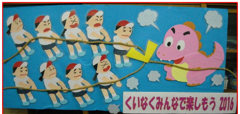
掲示ボランティアさんが部品を作り、掲示委員会の子どもたちが立体的に貼り合わせました。

掲示ボランティアのみなさんの制作物を紹介します。運動会を前にして6年生から要望のあった「綱引きを頑張る子ども」の作品が完成しました。おかげで大いに子どもたちの士気が上がり、今年も思い出に残る運動会になりました。季節の掲示をみんなが楽しみにしています。