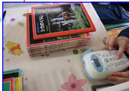
ラベルプリンターで分類番号を付けました。

図書ボランティアのみなさんは、図書の修理やわくわく講座の準備をしてくださいました。人気の本は、どうしても傷みやすいのですが、多くの子どもたちが気持ちよく本を読むよう丁寧に修理しています。