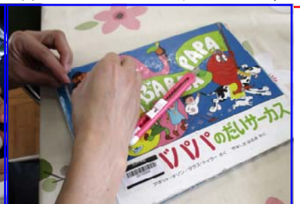
テープで背表紙を固定しました。