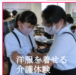
洋服を着せる介護体験