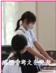
感想や考えを発表

やり直してもいいことやしょう来どんな職業について学ぶらいことがあるかもしれないけれどそれを乗り越えたらきといことがあると教えてもらったので少し勇気がわいてきました。ほくも乗り越えられるようにこれから力をつけていきたいです。